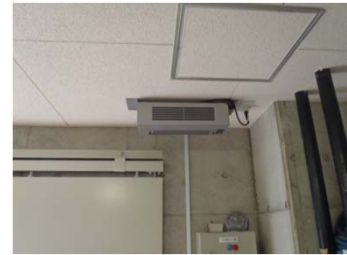
給気がドアの開閉のみの場合の取付例