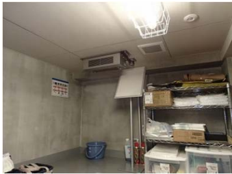
天井に給気口がある場合の取付例