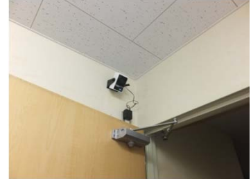
給気がドアの開閉のみの場合の取付例