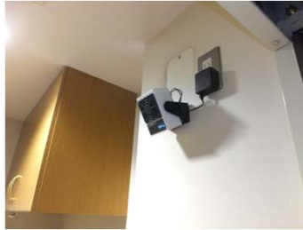
壁面の場合の取付例