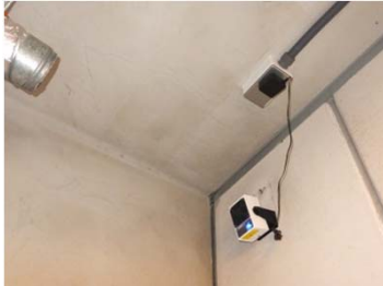
天井に給気口がある場合の取付例